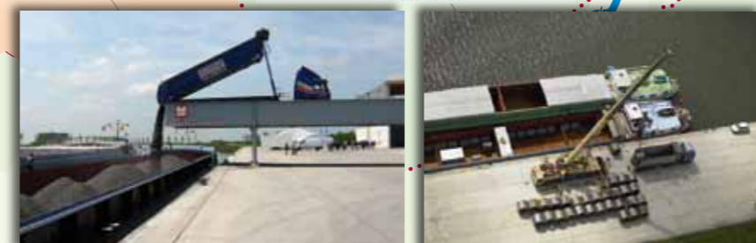
Chargement de granulats et déchargement de coils d'acier au port de Strépy.