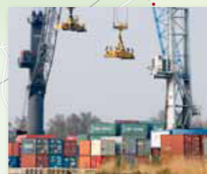
Trimodal Container Terminal Belgium (TCT) à Willebroek