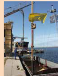
Manutention de céréales à Dunkerque Port VNF